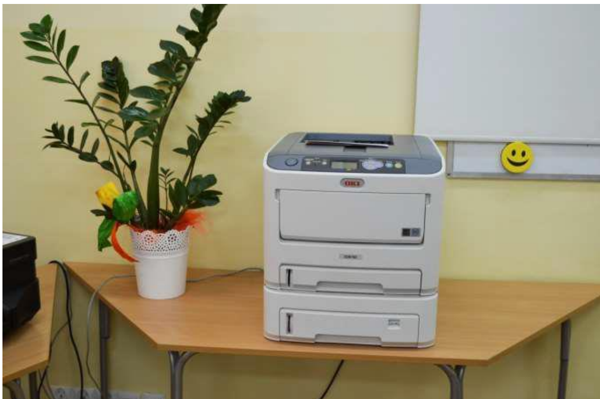
Fotografie zostały wykonane w naszych pracowniach.